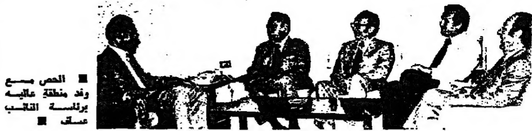
الحصص مع برنسة النائب صف